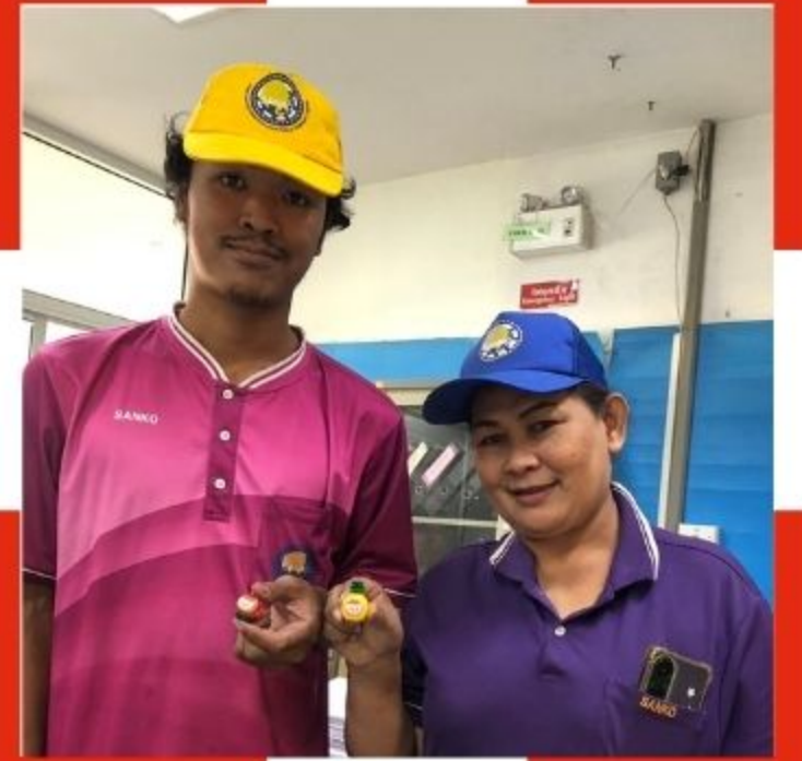
ผู้ร่วมกิจกรรม