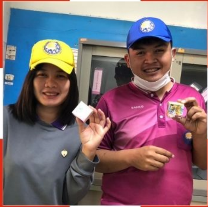
ผู้ร่วมกิจกรรม