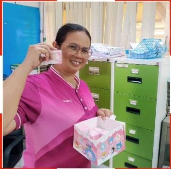
ผู้ร่วมกิจกรรม

ขอบคุณพนักงานทุกท่านที่ ร่วมเป็นส่วนหนึ่งของภารกิจให้