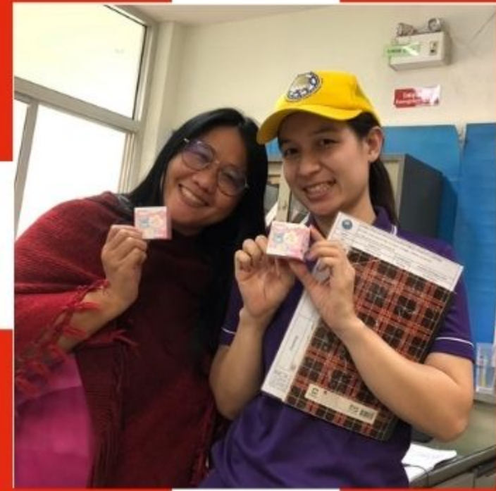
ผู้ร่วมกิจกรรม