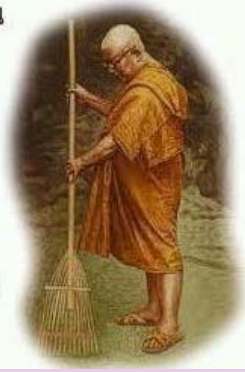
ท่านพุทธทาสภิกขุ

ต้องรอกจนกว่าจะได้เงิน ถึงจะรู้สึกพอใจ ถ้าทำงานเพื่องาน พอใจมือทำ ก็พอใจและเป็นสุขทันที แล้วเงินก็ไม่ไปไหนเสีย